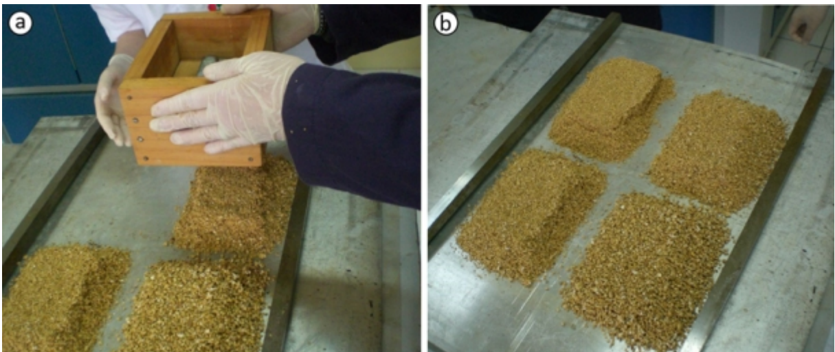
Figura 5. Montagem dos colchões de partículas: a) Colocação das partículas na caixa formadora; b) Colchões de partículas sobre a chapa, entre os afastadores.

A seguir, outra chapa metálica foi colocada sobre os colchões de partículas e os painéis foram colocados na prensa hidráulica. Após 6 minutos, as chapas