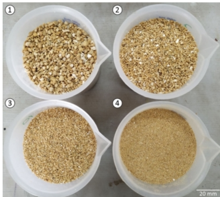
Figura 2. Partículas de porongo após peneiramento: 1) 10 mesh; 2) 16 mesh; 3) 30 mesh; 4) Pó.

Após a trituração dos resíduos no moinho de martelo foi realizado o peneiramento das partículas. Foram utilizados três tamanhos de peneiras granulométricas, em ordem decrescente do tamanho das partículas: 10, 16 e 30 mesh. O material foi peneirado e separado nos três diferentes tamanhos de partículas mais o pó, resíduo do processo de peneiramento, como pode ser observado na Figura 2.