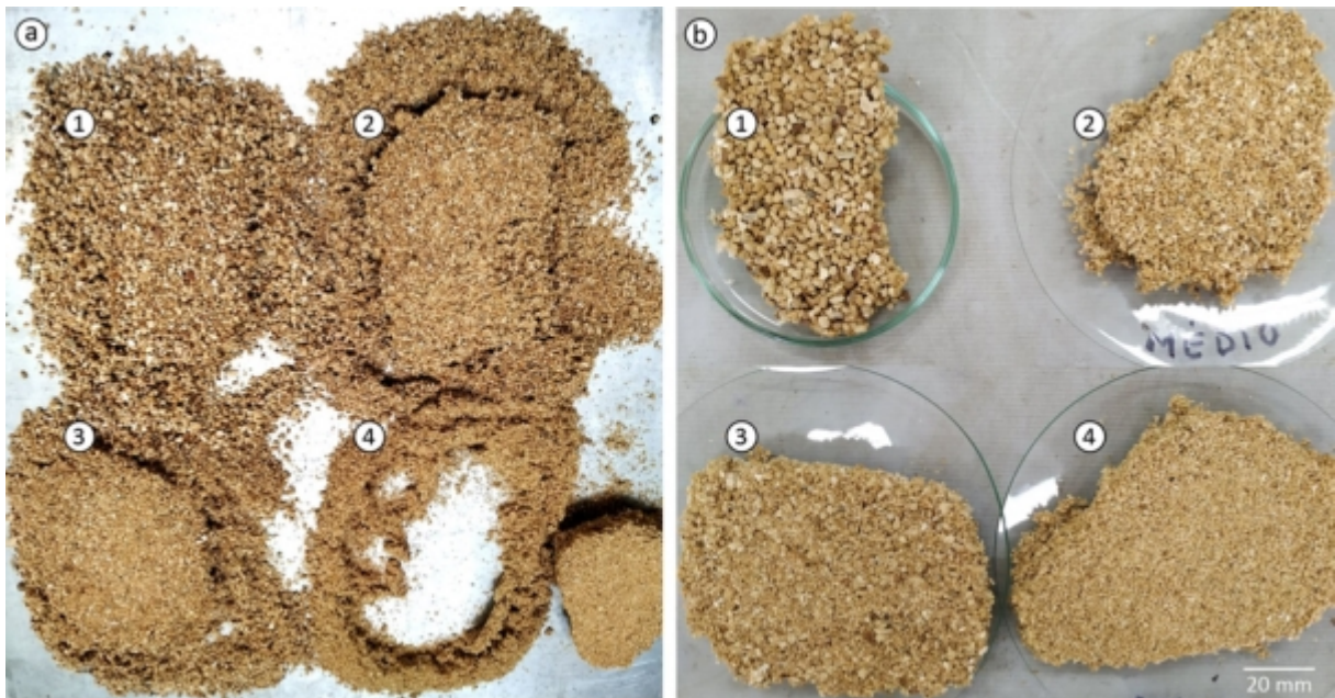
Figura 6. Painéis de partículas de porongo com resina ureia-formaldeído: a) Fraca adesão entre as partículas e o adesivo; b) Painéis removidos da chapa metálica. 1) Partículas de 10 mesh; 2) 16 mesh; 3) 30 mesh; 4) Pó do porongo.

Ao remover a chapa superior foi possível observar que não houve adesão homogênea entre as partículas e o adesivo. A adesão ocorreu no centro dos painéis e nas bordas as partículas ficaram soltas (Figura 6a).